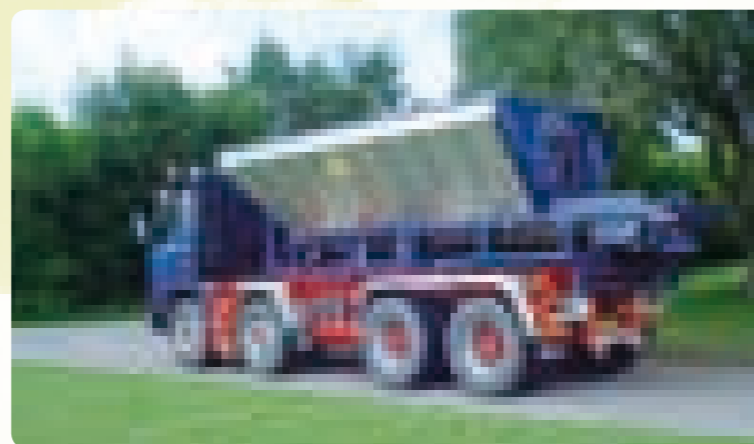
Загрузочный бункер с теплоизоляцией Bredal K125 (для транспортировки асфальта)

Загрузочные бункеры компании Bredal изготавливаются объемом от 2,5 м³ до 17 м³, как съемные конструкции для повышения гибкости использования транспортного средства.