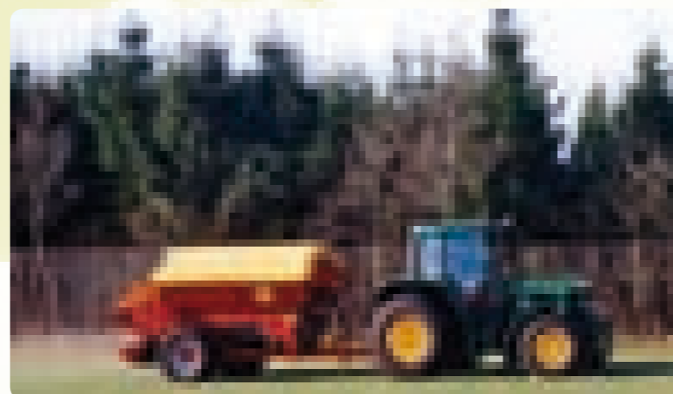
Разбрасыватели торфа K40 компании Bredal

Переход для выполнения этих различных задач очень простой и занимает несколько часов.