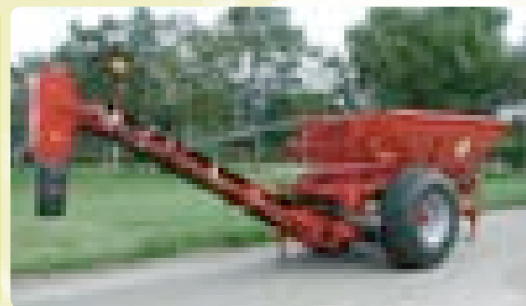
Конвейер для песка Bredal K65

Конвейерная лента легко устанавливается на трейлеры Bredal серии K-line с разбрасыванием от вала отбора мощности или с установкой гидравлического двигателя, если трейлер работает в режиме разбрасывания в зависимости от скорости перемещения. Конвейерная лента легко монтируется/демонтируется, а разбрасывающее устройство может быть установлено для разбрасывания извести, удобрений, компоста и т.д. Кроме того, может быть установлено зимнее оборудование для разбрасывания песка/соли.