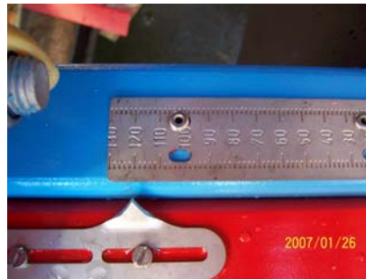
skala værdi 120

”Fingeren” skal følge nedløbspladen, som vist på det midterste billede ovenfor, samtidig skal den røre tallerknen, og kanten af ”kineserhatten” herpå.